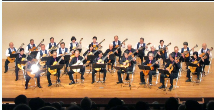
高槻ギタークラブ第9回発表会(2017)年より